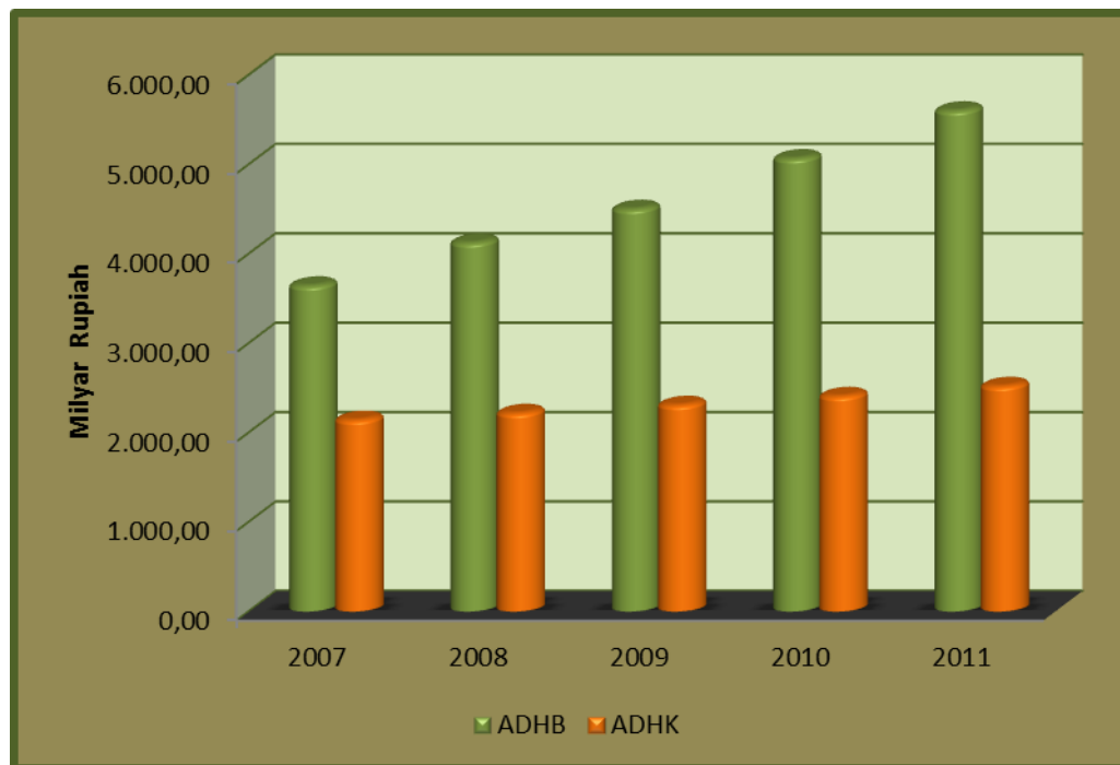
Grafik : 1. PDRB Kabupaten Temanggung Tahun 2007 – 2011

mengalami kenaikan. Pada tahun 2011 PDRB atas dasar harga berlaku sebesar 5.603,98 milyar rupiah, sedangkan atas dasar harga konstan sebesar 2.521,43 milyar rupiah. Sehingga dalam kurun waktu 11 tahun terakhir (2000-2011), PDRB Kabupaten Temanggung atas dasar harga berlaku mengalami kenaikan 3,37 kali sedangkan atas dasar harga konstannya mengalami kenaikan 1,51 kali (tahun 2000 = 1.662.794,54 juta rupiah). Berikut ini ilustrasi PDRB Kabupaten Temanggung Tahun 2007 – 2010 baik atas dasar harga berlaku maupun atas dasar harga konstan :